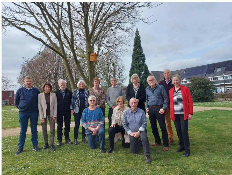
De vrijwilligers Op de foto ontbreekt Els Willems