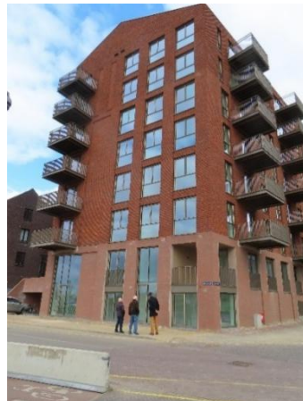
Opleveringsbezoek 'aan de Stadsmuur'