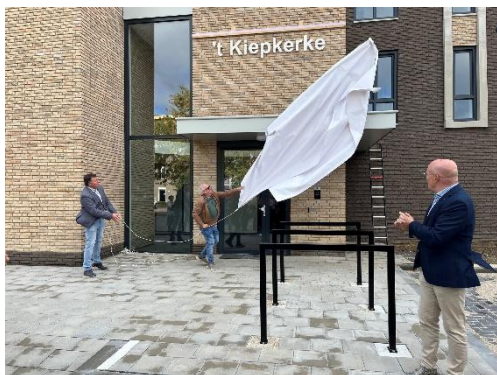
Feestelijke oplevering 't Kieperkerke

De naam 't Kieperkerke past goed bij de naam van het woongebouw ertegenover, dat 't Kleitremke heet. Het tremke met kieperkerkes staat symbool voor de Tegelse kleiwarenindustrie die zo oud is als Tegelen zelf: de Romeinen bakten in Tegelen al "tegulae".